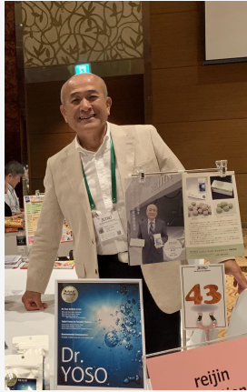
Vietnam (Ho Chi Minh City and Hanoi) Business Meeting