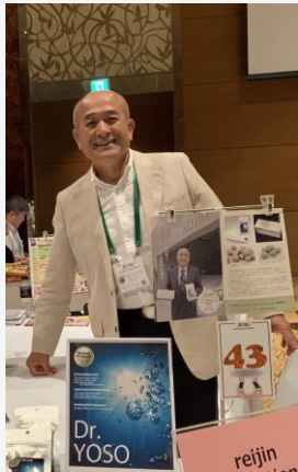
Vietnam (Ho Chi Minh City and Hanoi) Business Meeting